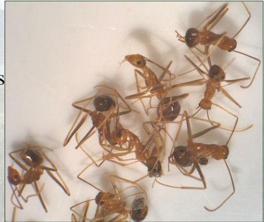
La fourmi folle jaune

Les espèces envahissantes peuvent avoir plus d'impact sur une population de proies que les prédateurs indigènes.