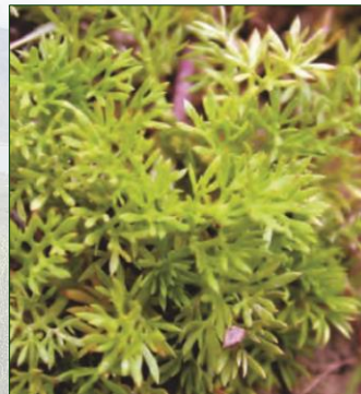
Le bugle rampant

Les espèces envahissantes font compétition avec les espèces indigènes pour des ressources essentielles telles que la nourriture et l'habitat.