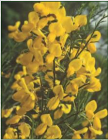
Le genet à balai

Les espèces envahissantes introduites peuvent rendre un habitat impropre aux espèces indigènes en modifiant sa structure ou sa composition.