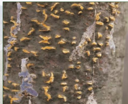
La "rouille vésiculeuse"

➤ Une espèce envahissante dans les Grands lacs