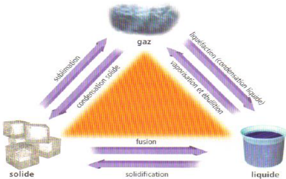
Figure 1.10 Les changements d'état